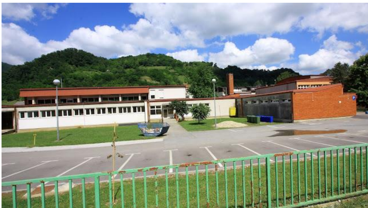
Slika 2. Osnovna škola Augusta Cesarca Krapina uključena u program CDŠ