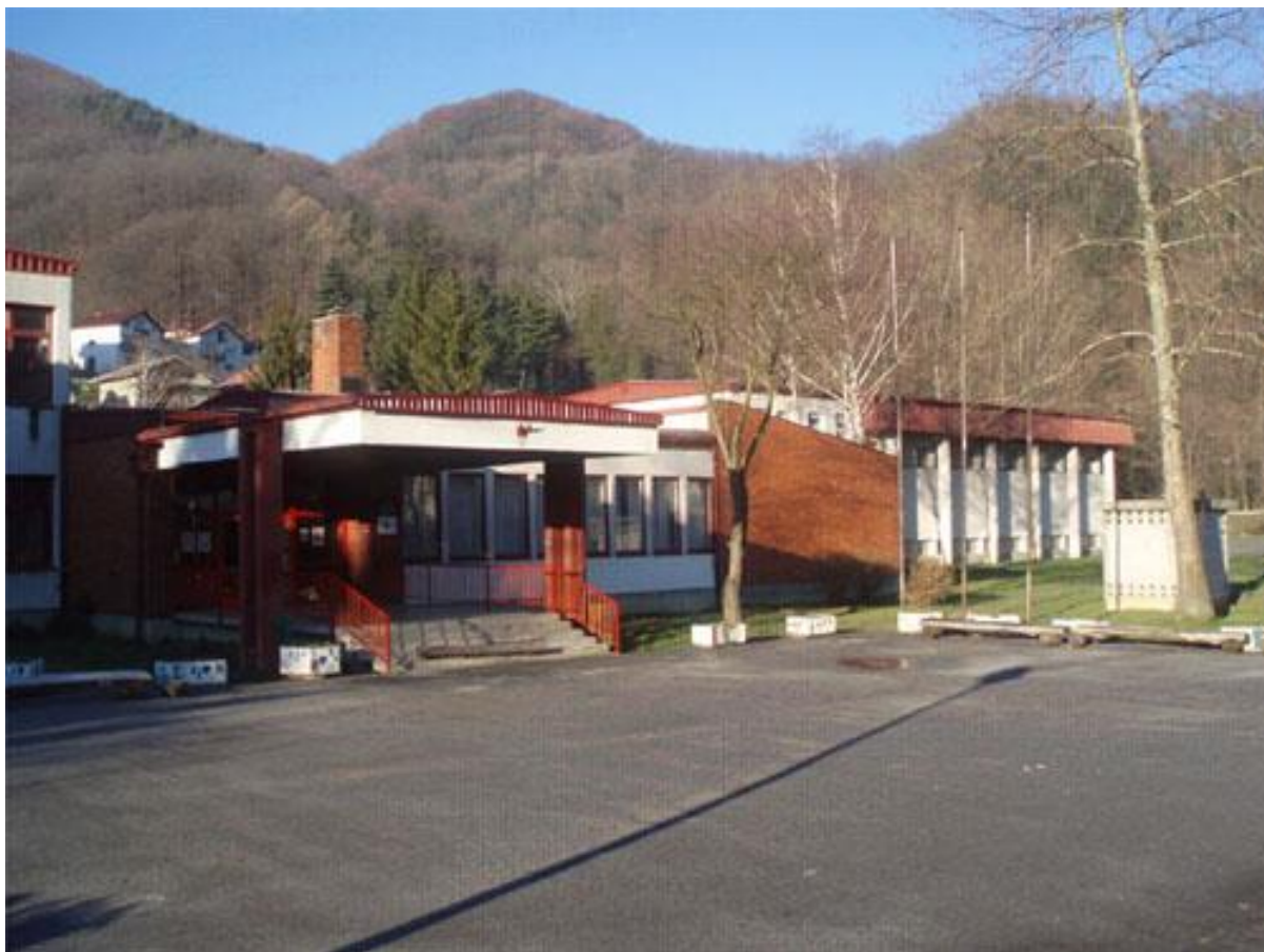
Slika 1. Osnovna škola Augusta Cesarca Krapina uključena u program CDŠ – glavni ulaz